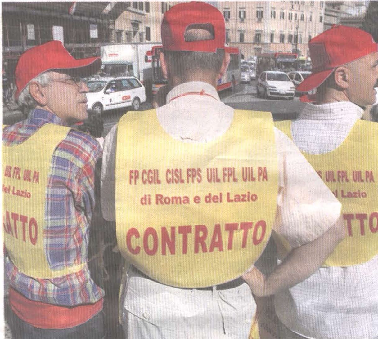
Una manifestazione di dipendenti pubblici

«Noi, come la Cisl, abbiamo sempre giudicato i governi per quello che fanno. Non abbiamo mai avuto rapporti privilegiati con nessuno, nean-